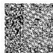
QR koda za plačilo

Pri izpisu računa ali predračuna lahko dodamo tudi QR kodo, s katero lahko kupci enostavno plačajo račun s skeniranjem preko telefona (gre za isto kodo, kot je na položnicah). Seveda je še vedno mogoč izpis računa s priloženo položnico. Pokličite za več informacij ali nastavitvev!