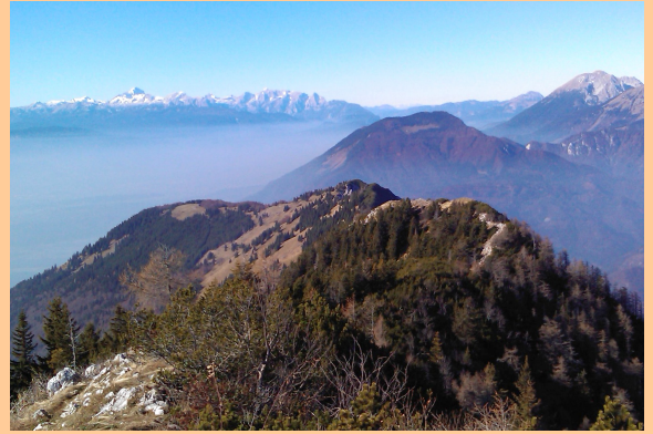
S Tolstega vrha proti Triglavu

(Če je res nujno, tudi izven rednega delovnega časa!)